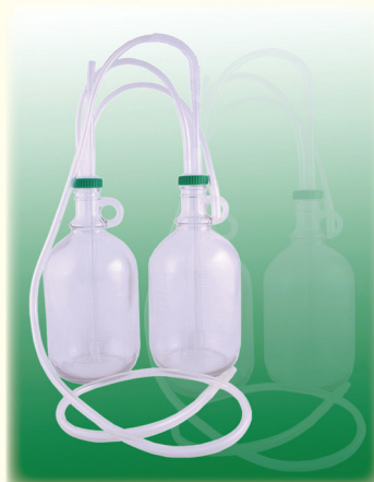
Двухкамерная дренажная система (бутыль стекло)