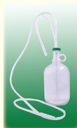
Однокамерная дренажная система (бутыль стекло)