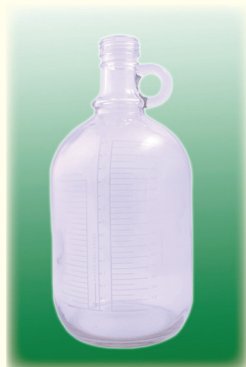
Бутыль дренажная (нестерильная/стерильная)